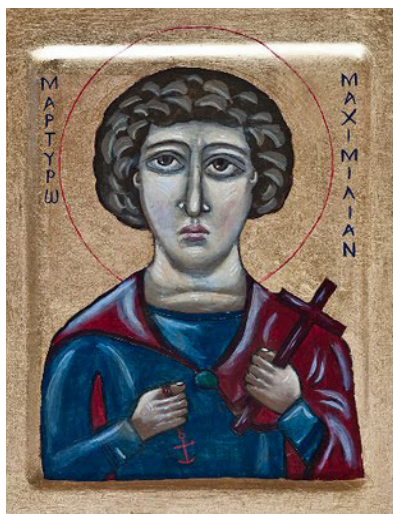
Sv. Maksimilijan od Tebessa 12. ožujka